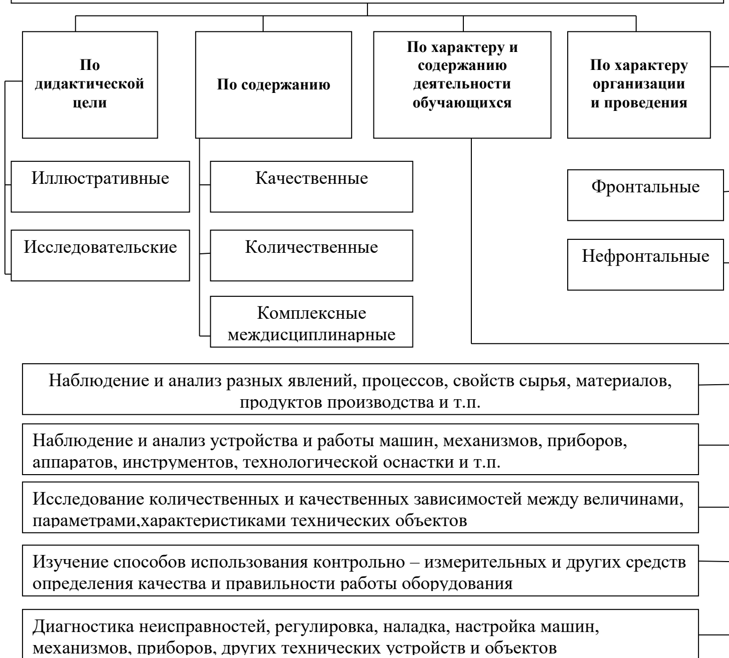
Схема 1. Классификация лабораторных (практических) работ